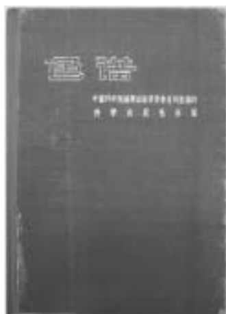
圖 1. 《色譜》封面